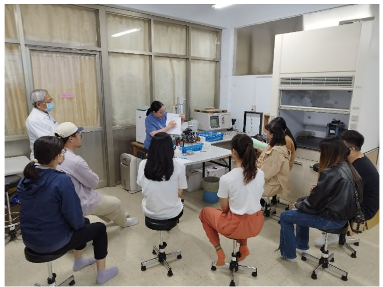
樣品前處理講解情形