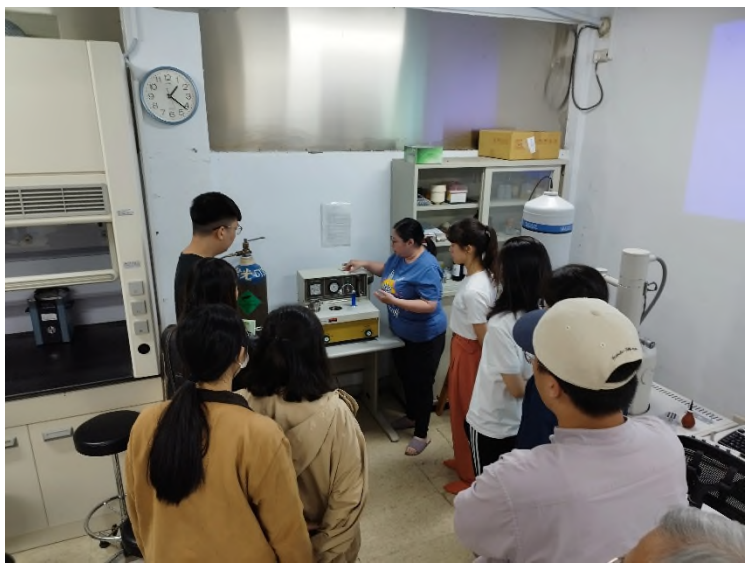
臨界點乾燥機講解情形